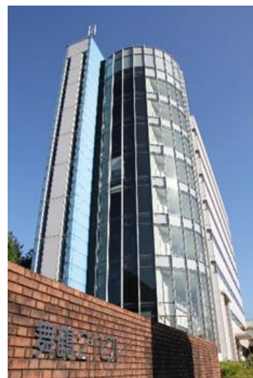
▲ 舞鶴 21 ビル <無料駐車場完備>

平素は、舞鶴 21 ビルをご利用いただきありがとうございます。 弊社ビルについてご案内いたしますので、ご利用いただきますようお願いいたします。